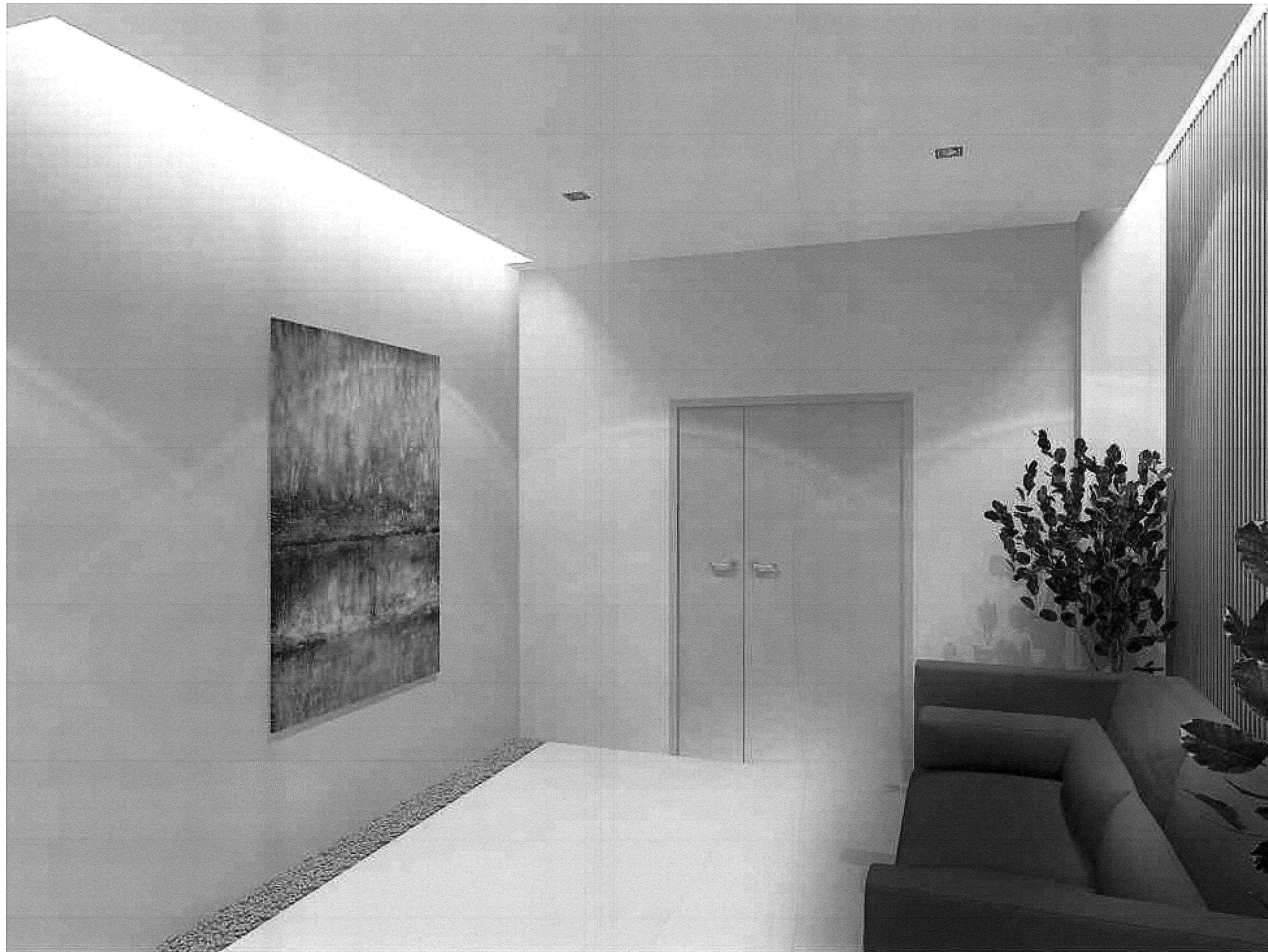
พักผ่อนส่วนสปปา