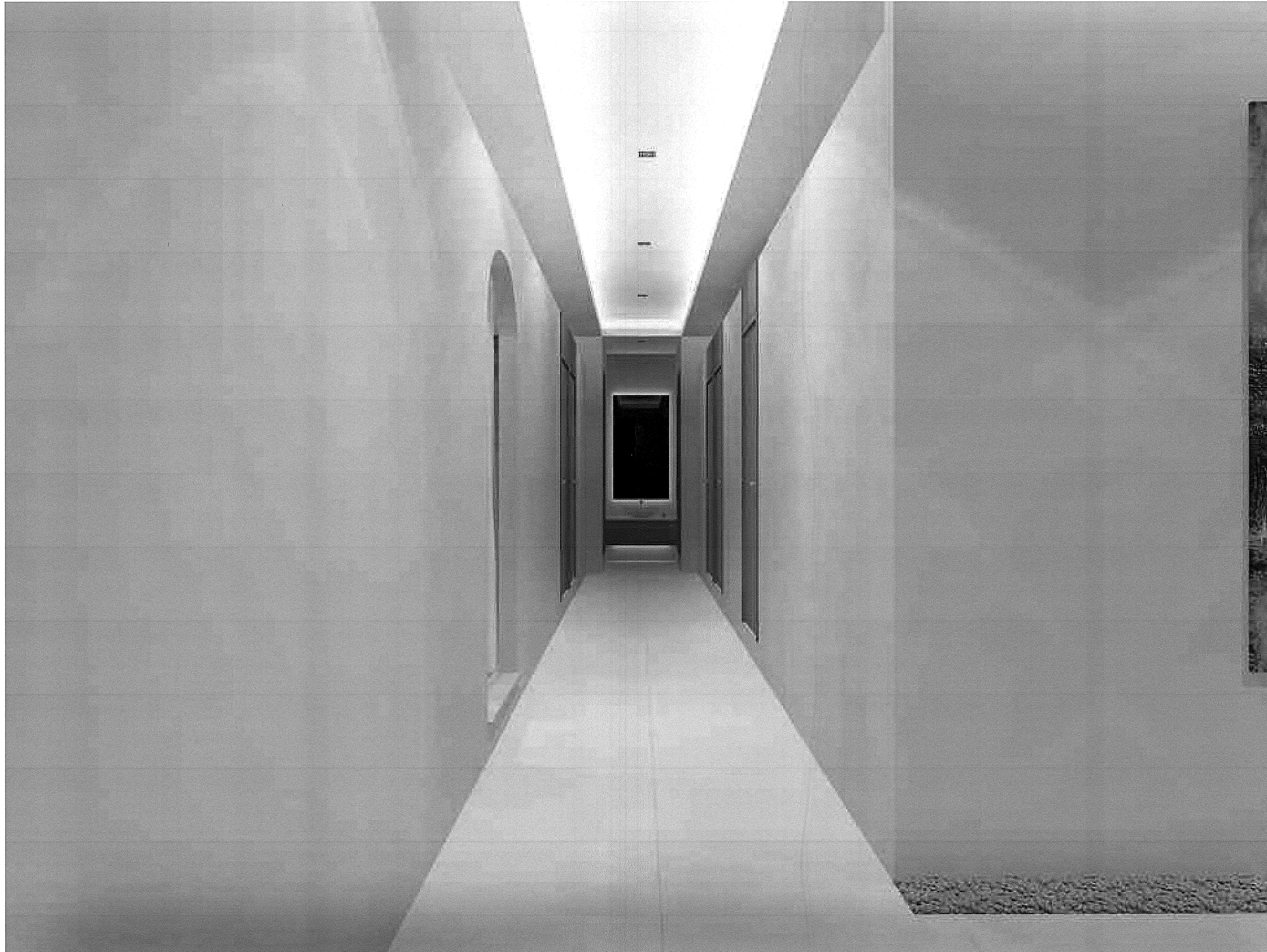
ทางเดินส่วนสปปา