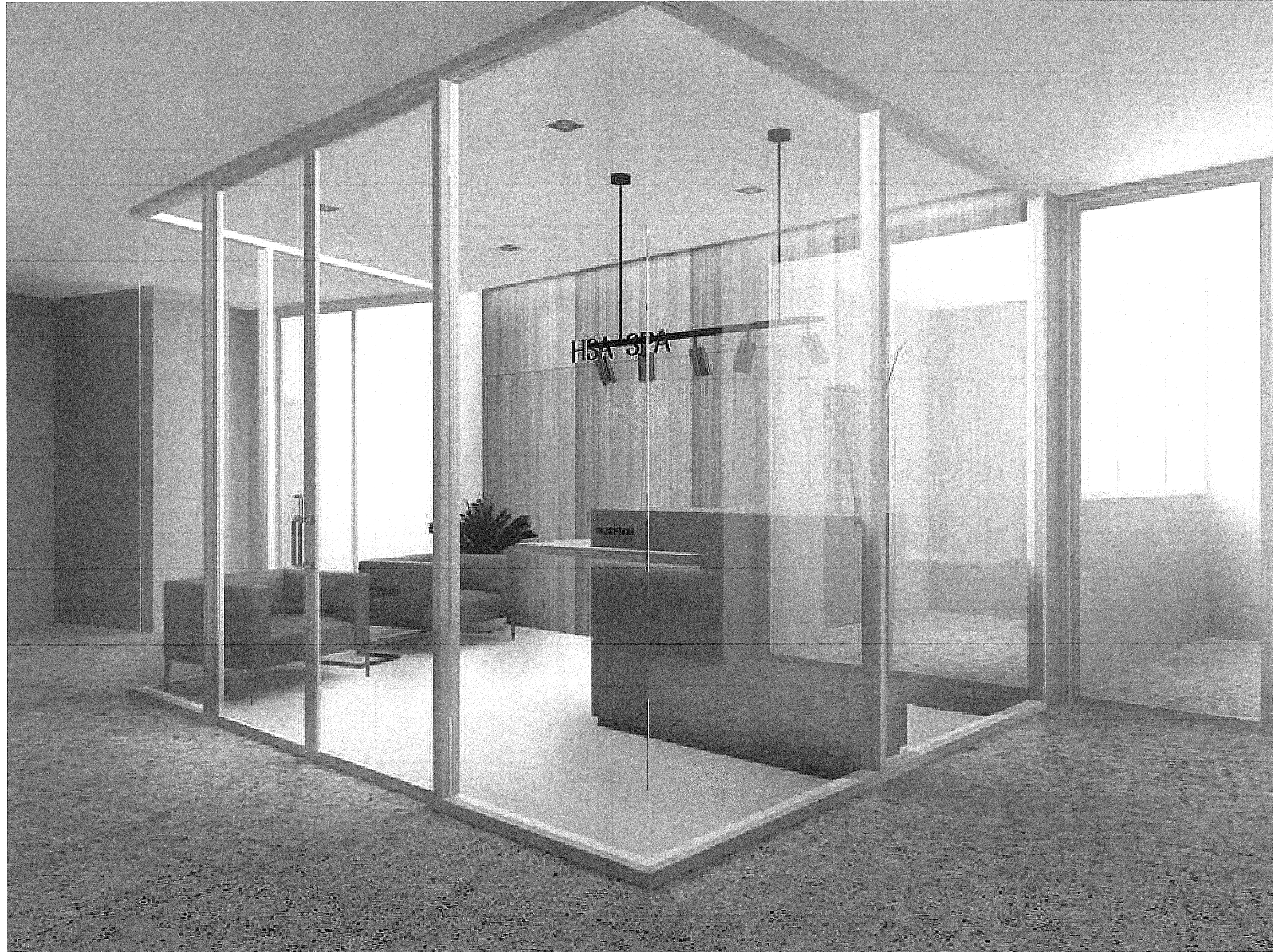
ส่วนต้อนรับ

* ระยะเวลาที่แสดงในแบบ ใช้เพื่อประกอบการจัดทำแบบเท่านั้น ให้ผู้รับจ้างสำรวจหน้างานเสร็จก่อนดำเนินการ/เสนอราคา *